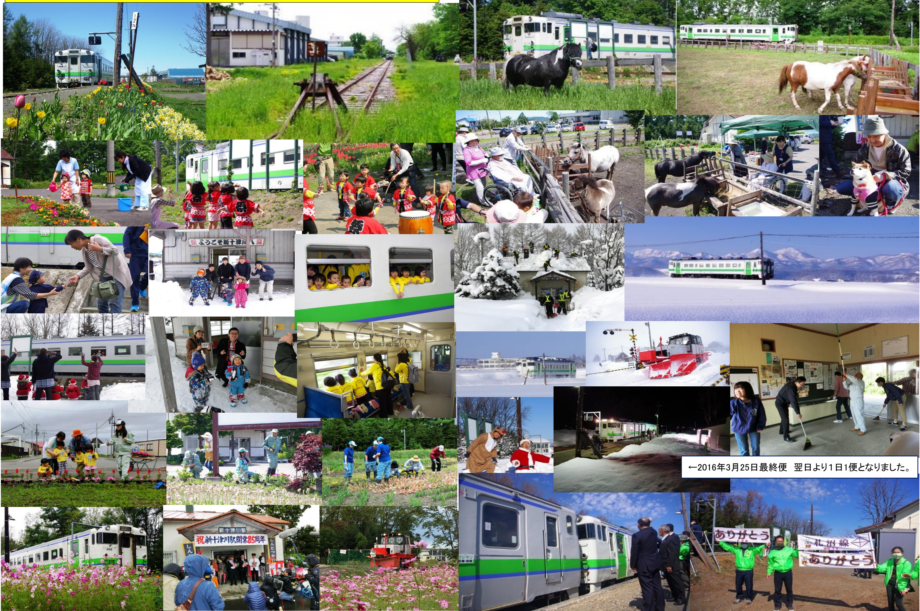
←2016年3月25日最終便 翌日より1日1便となりました。