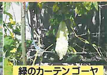
緑のカーテンゴーヤ