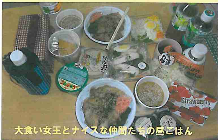
大食い女王とナイスな仲間たちの昼ごはん