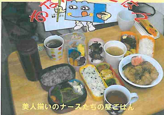
美人揃いのナースたちの昼ごはん