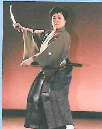
『霧の川中島』踊っています

今日もやってきました～。今回は院内で一番入院患者の多い病棟だぞお～。この病棟の若い男性スタッフがは沢山食べると思ったが・・・？ ところが・・・？ 実際は・・・？！