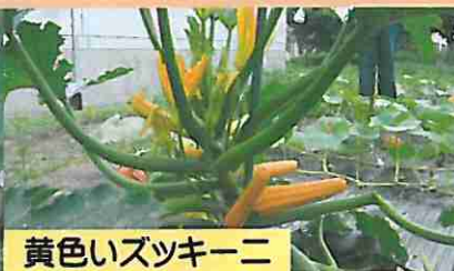
黄色いズッキーニ