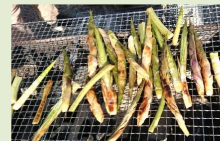
バーベキューも楽し

という風に北海道の根曲がり竹、これなかなかの代物。これなら皆タケノコ採りに夢中になるのも分かります。当院でも自分なりの秘密の場所がある人も多いようすし、この季節、休みとなるとあっちこっちへ。ただ背丈2～3メートルになる竹、周囲も見渡せず根元ばかり見ながら前進前進ですから、突然の熊との遭遇などくれぐれもご注意を。