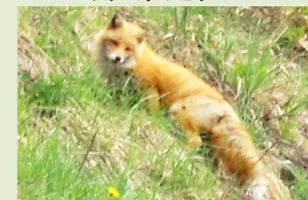
北キツネがいたよ