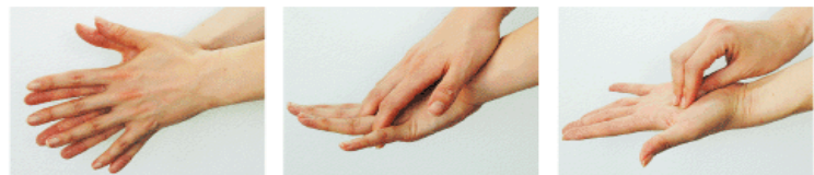
1. 手のひらを合わせてよく洗う 2. 手の甲を伸ばすように洗う 3. 指先・爪の間をよく洗う