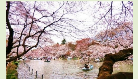
サクラも色々 東京井之頭子公園

そんな事を考えながらその日は深夜まで、ウィスキーはロックに甘納豆パン。いや〜グッド!でした。