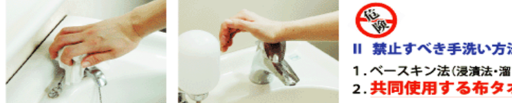
7. 水道の栓を止める時は、手首が射で止める・ペーパータオルを使用して止める。