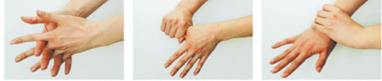
4. 指の間を十分に洗う 5. 親指と手掌をねじり洗います 6. 手首を洗う